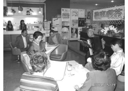
第1回“歌声喫茶”の様子