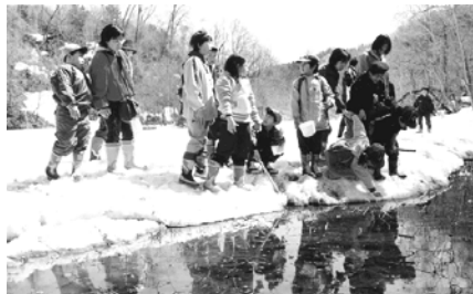
赤平の新名所“赤平湿原”！？

4月24日(日)は晴天に恵まれ、残雪のゴリョウ川沿いからダムまで往復約2時間。カエルやサンショウウオ・水たまりのあちこちのおたまじゃし。そして春のいぶきの露のとう、