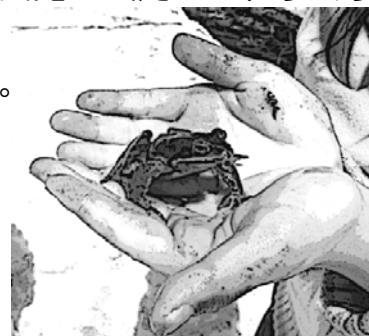
とても愛らしい“アカガエル”